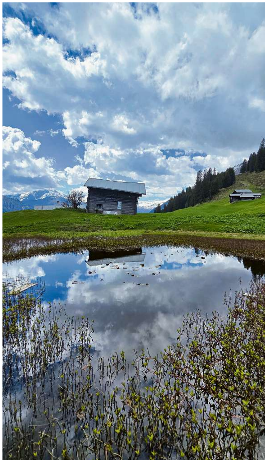
Die Allmeinhütten in Tenna.